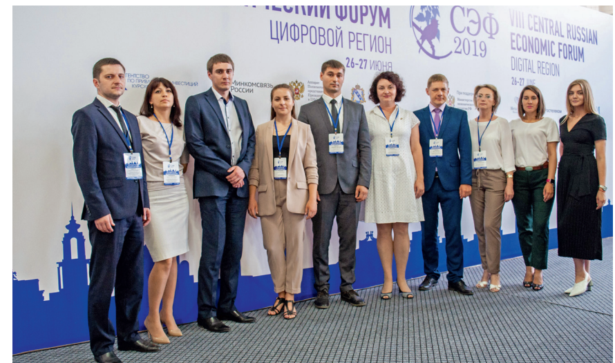
VIII Среднерусский экономический форум, 25-26 июня 2019 г.