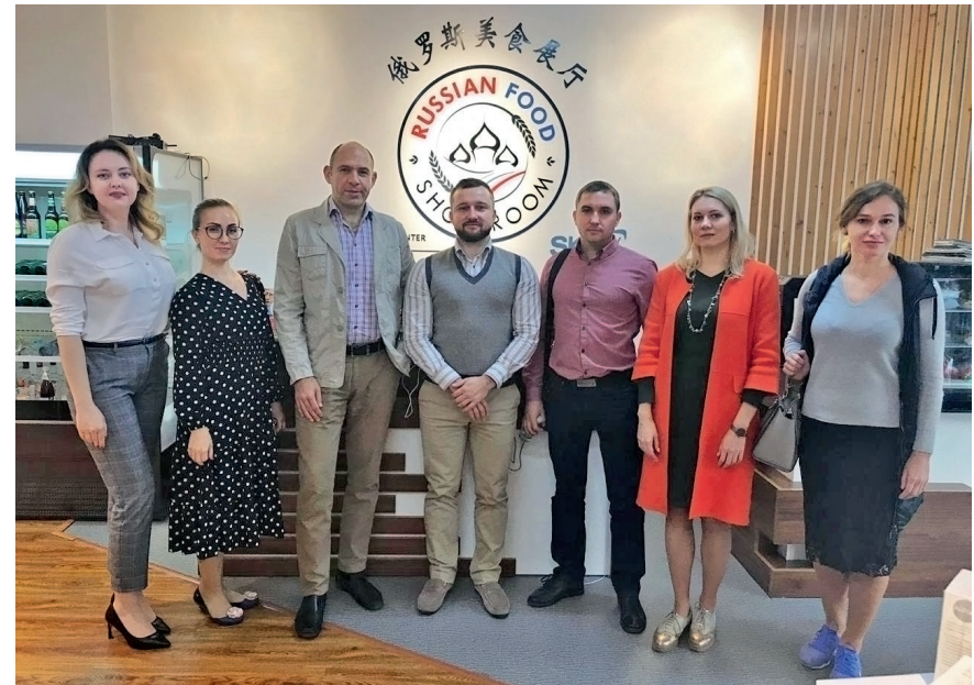
Бизнес-миссия в г.Шанхай, Китай, 12-14 ноября 2019г.