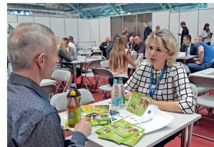
Бизнес-миссия в Республику Беларусь, 17-19 сентября 2019г.