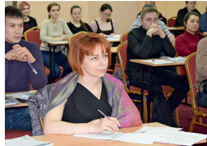
Тренинг по программе Корпорации МСП «Финансовая поддержка»