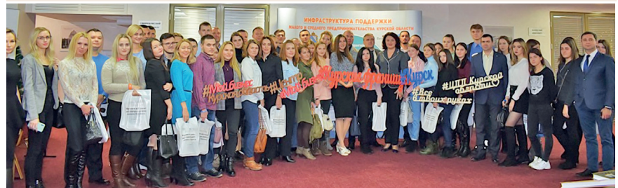
Конференция «Франчайзинг как стимул для развития малого бизнеса», 22 ноября 2019 г.