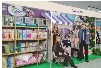
23-я международная выставка HouseHold Expo, 27 февраля – 01 марта 2019г.