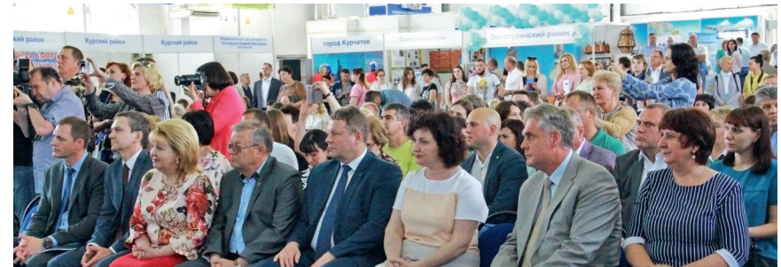
Региональный форум малого и среднего предпринимательства «День предпринимателя Курской области», 24 мая 2019 г.