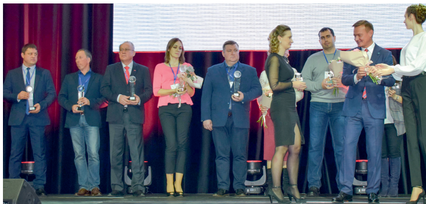
Итоговый форум «Мой бизнес-моё будущее», 9 декабря 2019 г.