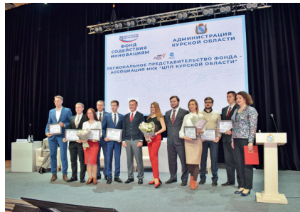
Региональная конференция «Малый бизнес Курской области в реализации национальных проектов», 22 марта 2019 г.