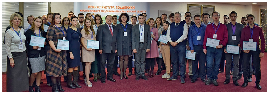
Региональный форум молодежных инноваций, 20 ноября 2019 г.