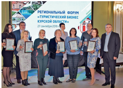
Региональный форум «Туристический бизнес Курской области», 27 сентября 2019 г.