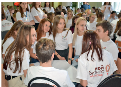
Деловая игра для школьников «Первые шаги в предпринимательство»