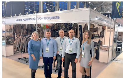
45-ая Международная выставка «Охота и рыболовство на Руси», 03 марта 2019г.