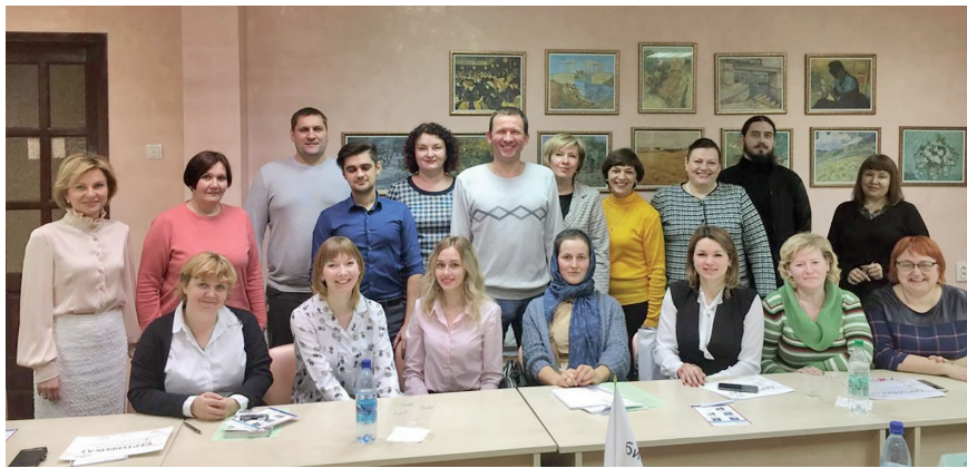
Программа «Наставничество в предпринимательской среде»