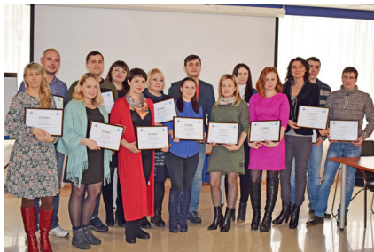
Обучение по программе Корпорации МСП «Азбука предпринимателя» в г. Железногорск