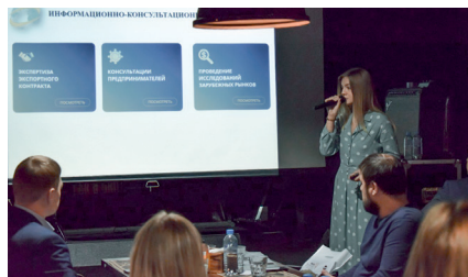
Бизнес-завтрак для экспортно ориентированных компаний Курской области, 01 августа 2019