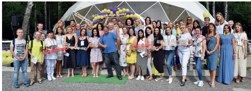
II Региональный Форум социального бизнеса, 25 июня 2019 г.