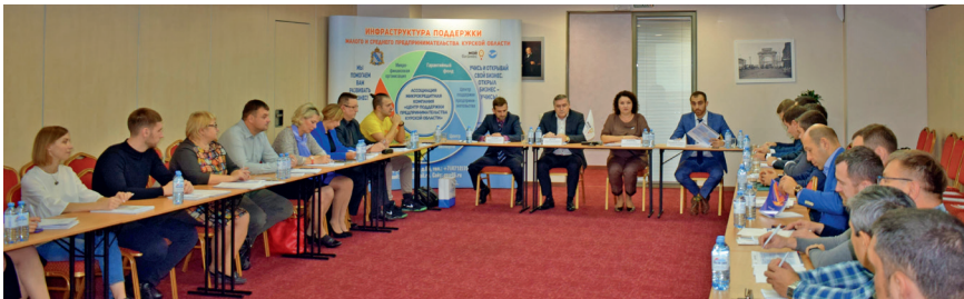
Круглый стол «Возможности инжиниринга для развития малого предприятия. Перспективы участия в программе выращивания», 15 октября 2019 г.