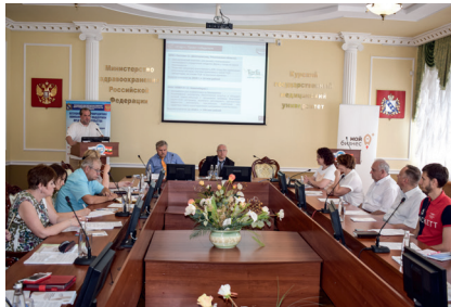
Круглый стол: «Бизнес и медицинская наука: вопросы взаимодействия», 11 июня 2019 г.