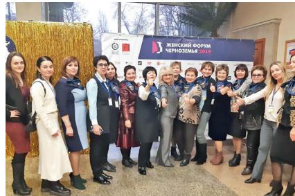
Женский форум Черноземья 2019 г. Воронеж