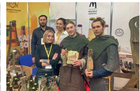
Предприниматели региона на 28-й Международной продовольственной выставке «ПЕТЕРФУД-2019», 19-21 ноября 2019г.