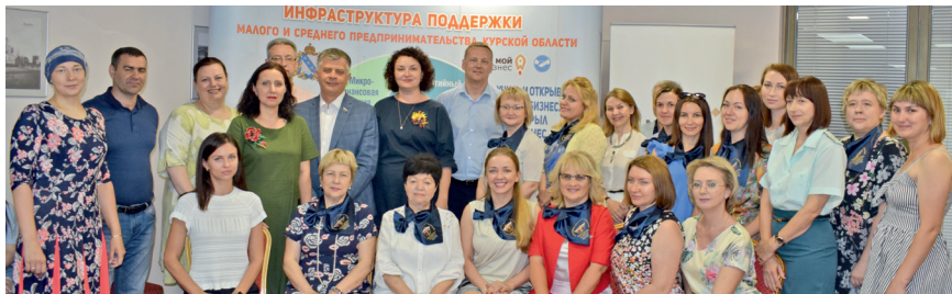
Круглый стол на тему: «Самозанятость. Есть ли смысл выходить из тени?», 17 июня 2019 г