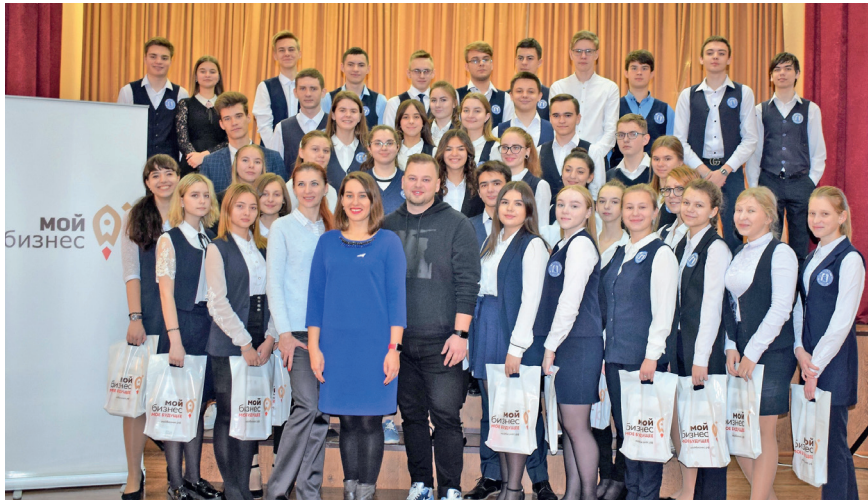
Открытые уроки с участием действующих предпринимателей