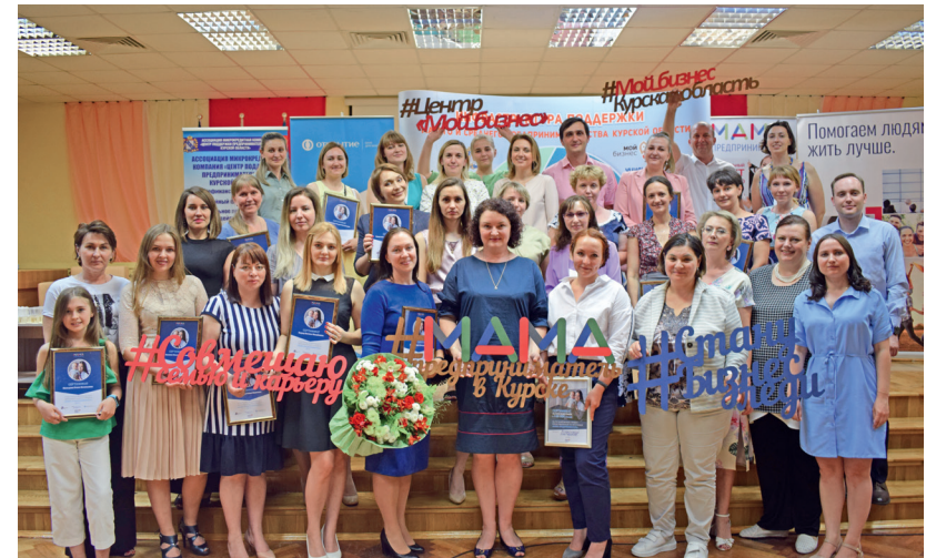
Обучение по программе Корпорации МСП «Мама-предприниматель»