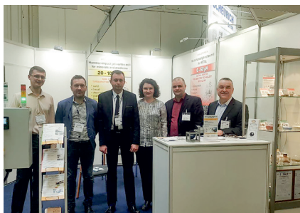
Международная выставка переработки, анализа и обработки порошковых и сыпучих материалов Powtech 2019 (Германия, г. Нюрнберг). 09-11.04.2019