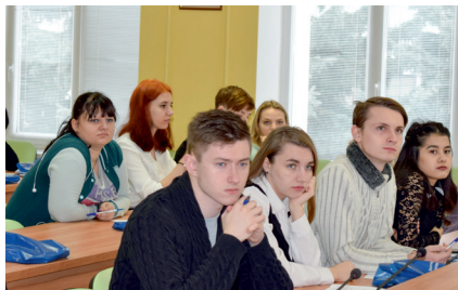
Обучение по программе Корпорации МСП «Генерация бизнес-идеи»