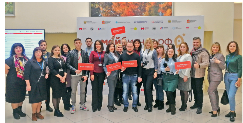
Форум «Мой бизнес» г. Красногорск, 18 ноября 2019г.