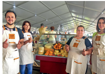
Всероссийский сырный фестиваль «Сыр! Пир! Мир!», 9-11 августа 2019г.